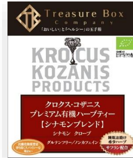
【シナモン・ブレンド】 シナモン、クローブ(丁子)、サフラン