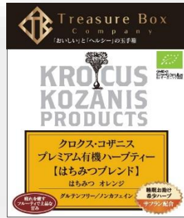
【はちみつブレンド】 はちみつ、オレンジ、サフラン