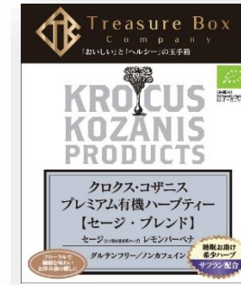
【セージ・ブレンド】 セージ(シソ科の多年草ハーブ)、 レモン・ヴェルベーン、サフラン