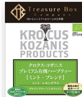
【ミント・ブレンド】 ミントレ、モングラス、サフラン