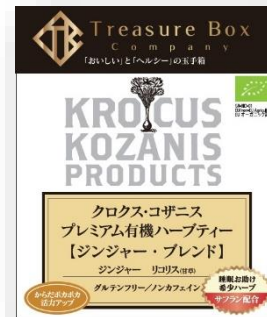
【ジンジャー・ブレンド】 ジンジャー、リコリス(甘草)、サフラン